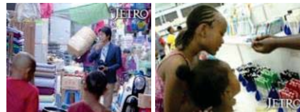
「変わるミャンマー」