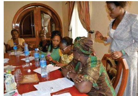
受容性調査の様子（ナイジェリア）

日本貿易振興機構（JETRO） ビジネス展開支援部 途上国ビジネス開発課 BOP班