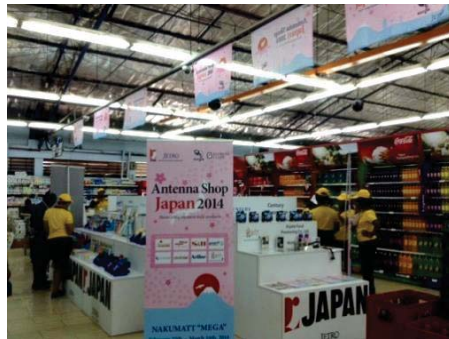
試験販売の様子（ケニア）